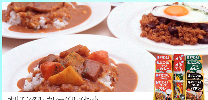
オリエンタル カレーグルメセット

もっちりとした食感が特徴の「ひとつくち」と、季節をイメージしたうろくに餡を入れ込んだ「四季づくし」をそれぞれ詰め合わせました。