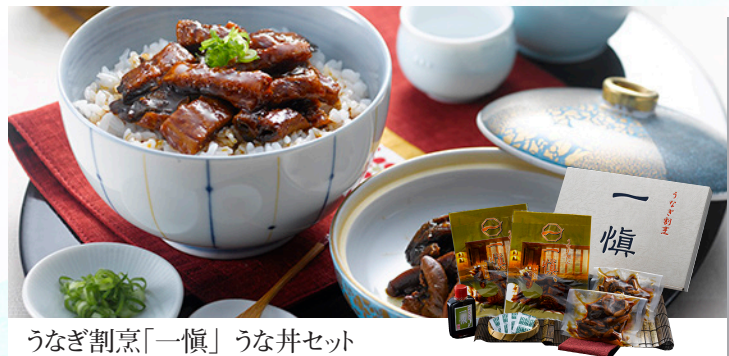
うなぎ割烹「一燗」うなぎセット きざみ鰻と鰻の肝煮の「うなぎ」セットです。香りとコクのある「一燗特製」の蒲焼のたれは鰻本来の旨味を引き立たせます。うなぎ割烹「一燗」の自慢の味を是非ご家庭でご賞味ください。