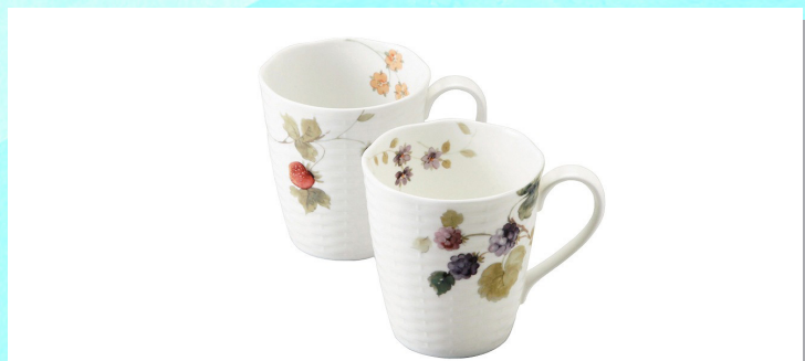
NARUMI ルーシーガーデン ペアマグ カゴ目のレリーフが施されたボディにジャムに加工できる果物を描きました。誰からも好まれるストロベリーとブラックラズベリーの絵柄のマグカップ。たっぷり入るサイズ。マグカップの内側には花が描かれています。