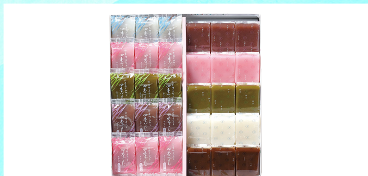
青柳総本家 ひとつくちセット

桂新堂を代表する海老菓子である「あられ焼き」「姿焼き」「磯焼き」「炙り焼き」を詰合せました。