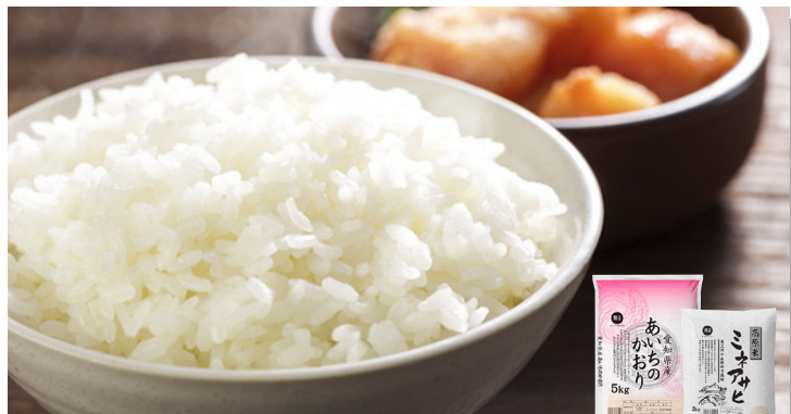
愛知県産 あいちのかおり 5kg・ミネアサヒ 2kg 愛知県を代表する2銘柄をセットにしました。食べ比べをお楽しみください。