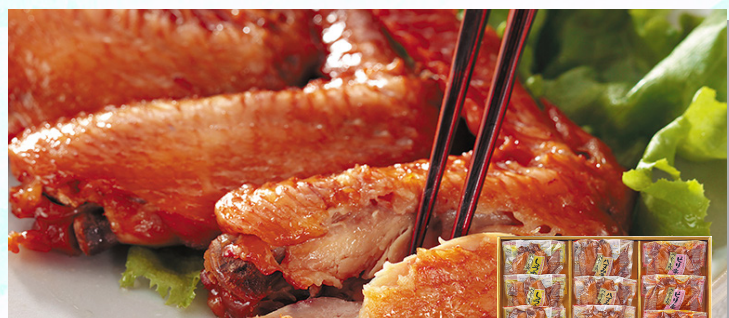
石昆 うみあーっ手羽詰合せ 国産の手羽先を、天然真昆布だしの旨味がたっぷりとしみわたるまでじっくりと時間をかけて炊きあげましたので、箸で簡単にほぐれるほど柔らかい身の煮手羽です。