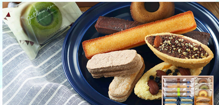
名古屋ふらんす ル・キャドール 18個入

爽やかな酸味の効いた上質なレモンをふんだんに使用して仕上げたパウンドケーキと、ノスタルジックな味わいの檸檬ケーキの詰合せです。