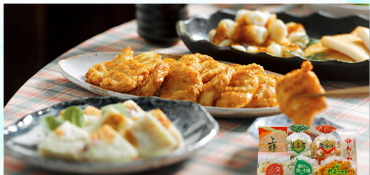
ヤマサちくわ ヤマサちくわ詰合せ 文政10年創業の老舗「豊橋名産ヤマサちくわ」の代表的商品を集めた詰合せです。そのまま生でお好みでわさび醤油を付けてお召上がりください。