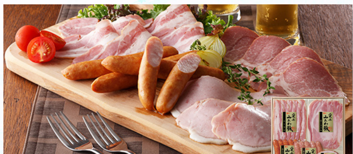
スギモト みかわ豚ハムバラエティー 愛知県産のブランド豚「愛知みかわ豚」は臭みがなくもちりとした食感から「もち豚」と称されております。素材の持つ美味しさをお楽しみいただけるようにシンプルな味付けで仕上げしております。