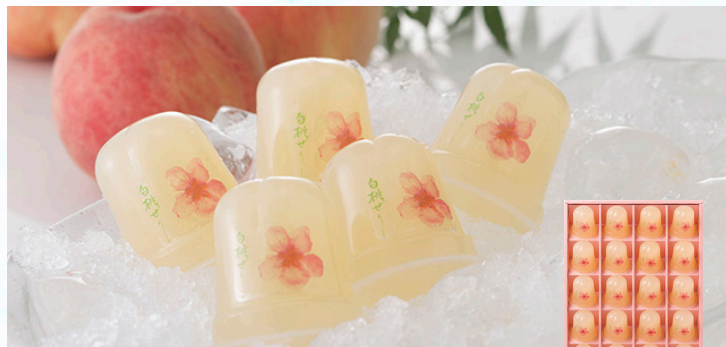
桃花亭 プチ完熟白桃ゼリー 20個入

地元愛知県産の完熟した桃を丁寧に湯むし、果実の繊維を残す製法で完熟白桃の美味しさを追求しました。