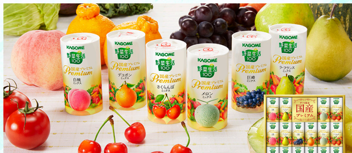
カゴメ 野菜生活100国産プレミアムセット

名古屋ふらんす直営店オリジナルの焼き菓子を詰め合わせたバラエティ豊かなギフトセットです。