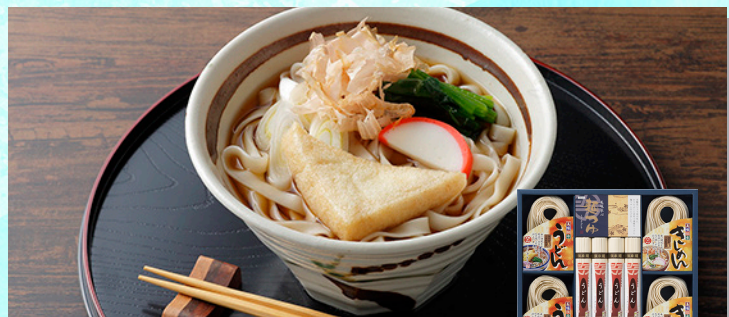
なごやしめん亭 ふるさと麺詰合せ つつるつるしこしこした手折り麺の「きしめん」「うどん」と長時間乾燥で仕上げた早ゆでタイプの「うどん」の詰合せです。カツオ・昆布のだしの効いた「めんつゆ」でお楽しみください。