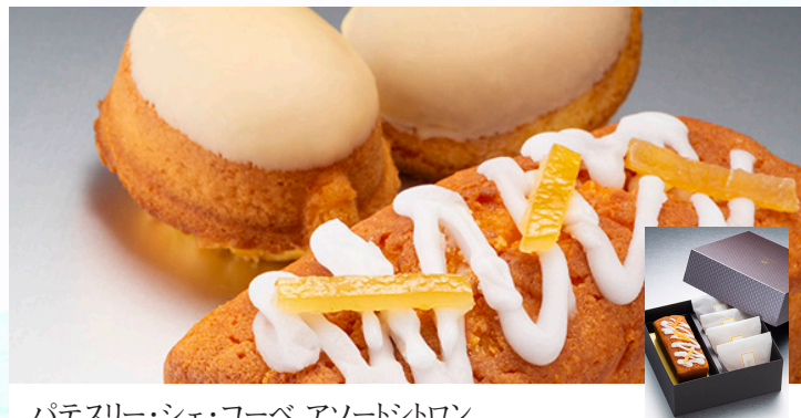
パテスリー・シェ・コーベ アソートシトロン

地元愛知県産の完熟した桃を丁寧に湯むし、果実の繊維を残す製法で完熟白桃の美味しさを追求しました。